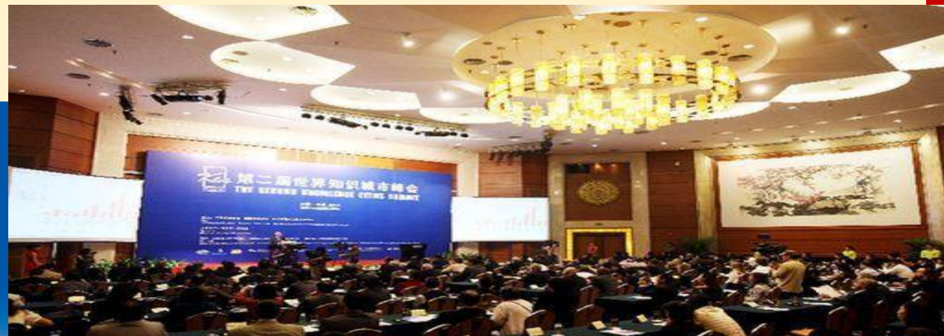
深圳荣获第二届“杰出的发展中的知识城市”奖